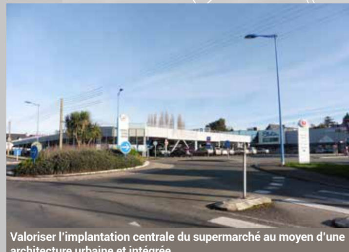
Valoriser l'implantation centrale du supermarché au moyen d'une architecture urbaine et intégrée