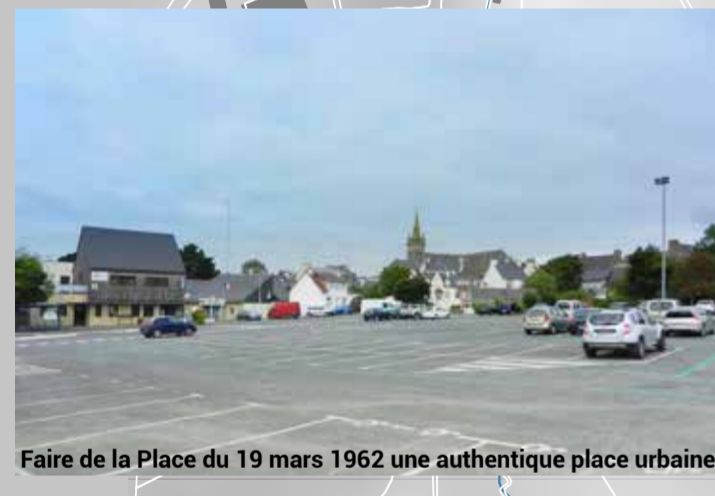
Faire de la Place du 19 mars 1962 une authentique place urbaine

(En aménagement urbain, une action amorcée à brève échéance exige souvent le long terme pour sa complète réalisation)