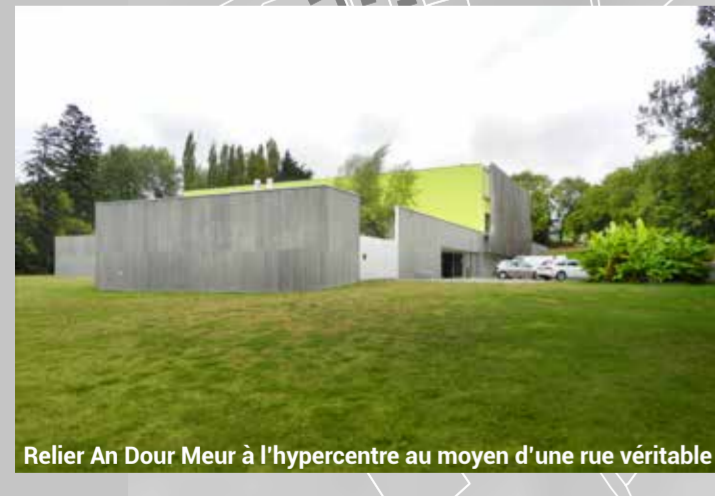
Relier An Dour Meur à l'hypercentre au moyen d'une rue véritable