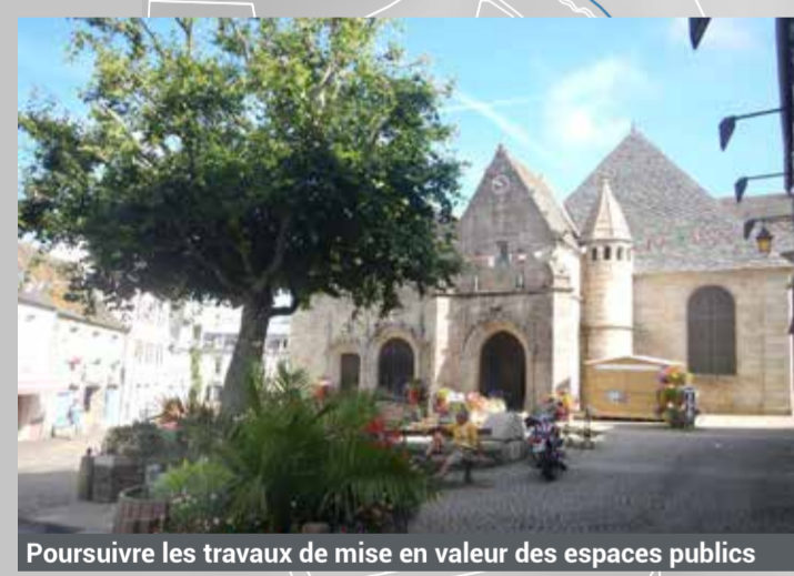
Poursuivre les travaux de mise en valeur des espaces publics